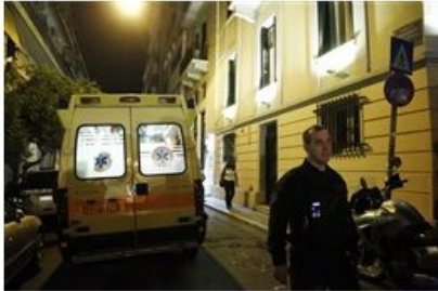
Ασθενοφόρο και άνδρες της ασφάλειας έξω από το δικηγορικό γραφείο που δολοφονήθηκε ο ποινικολόγος Μιχάλης Ζαφειρόπουλος και γιος του πρώην βουλευτή της Νέας Δημοκρατίας, Επαμεινώνδα Ζαφειρόπουλου, Πέμπτη 12 Οκτωβρίου 2017. ΑΠΕ ΜΠΕ/ΑΠΕ ΜΠΕ/ΓΙΑΝΝΗΣ ΚΟΛΕΣΙΔΗΣ (File: 18584208.JPG )