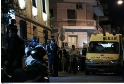
(File: 20171012_liakos_dolofonia03.JPG )