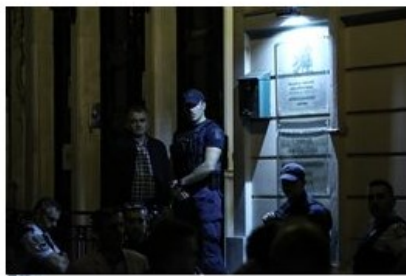
(File: 20171012_liakos_dolofonia05.JPG )