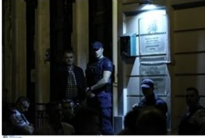
(File: 20171012_liakos_dolofonia05.JPG )