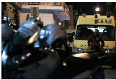
(File: 20171012_liakos_dolofonia04.JPG )