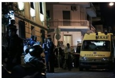
(File: 20171012_liakos_dolofonia03.JPG )