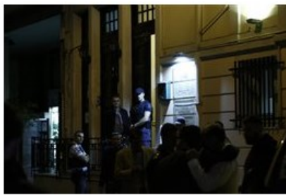
Συγγενείς και φίλοι αντιδρούν έξω από το δικηγορικό γραφείο μετά το άκουσμα της δολοφονίας του ποινικολόγου Μιχάλη Ζαφειρόπουλου και γιου του πρώην βουλευτή της Νέας Δημοκρατίας, Επαμεινώνδα Ζαφειρόπουλου, Πέμπτη 12 Οκτωβρίου 2017. ΑΠΕ ΜΠΕ/ΑΠΕ ΜΠΕ/ΓΙΑΝΝΗΣ ΚΟΛΕΣΙΔΗΣ (File: 18584195.JPG )