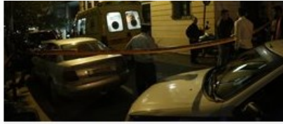
Ασθενοφόρο και άνδρες της ασφάλειας έξω από το δικηγορικό γραφείο που δολοφονήθηκε ο ποινικολόγος Μιχάλης Ζαφειρόπουλος και γιος του πρώην βουλευτή της Νέας Δημοκρατίας, Επαμεινώνδα Ζαφειρόπουλου, Πέμπτη 12 Οκτωβρίου 2017. ΑΠΕ ΜΠΕ/ΑΠΕ ΜΠΕ/ΓΙΑΝΝΗΣ ΚΟΛΕΣΙΔΗΣ (File: 18584198.JPG )