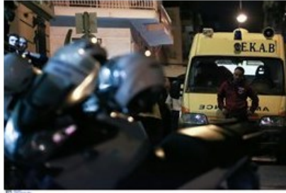
(File: 20171012_liakos_dolofonia04.JPG )