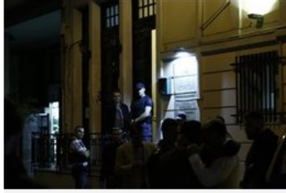
Συγγενείς και φίλοι αντιδρούν έξω από το δικηγορικό γραφείο μετά το άκουσμα της δολοφονίας του ποινικολόγου Μιχάλη Ζαφειρόπουλου και γιου του πρώην βουλευτή της Νέας Δημοκρατίας, Επαμεινώνδα Ζαφειρόπουλου, Πέμπτη 12 Οκτωβρίου 2017. (File: 18584195.JPG )