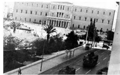
Ξημερώματα 21ης Απριλίου 1967: Τεθωρακισμένα στην πλατεία Συντάγματος

Δημοσίευση: 21 Απρ 2017, 11:42 | Τελευταία ενημέρωση: 21 Απρ 2017, 11:42